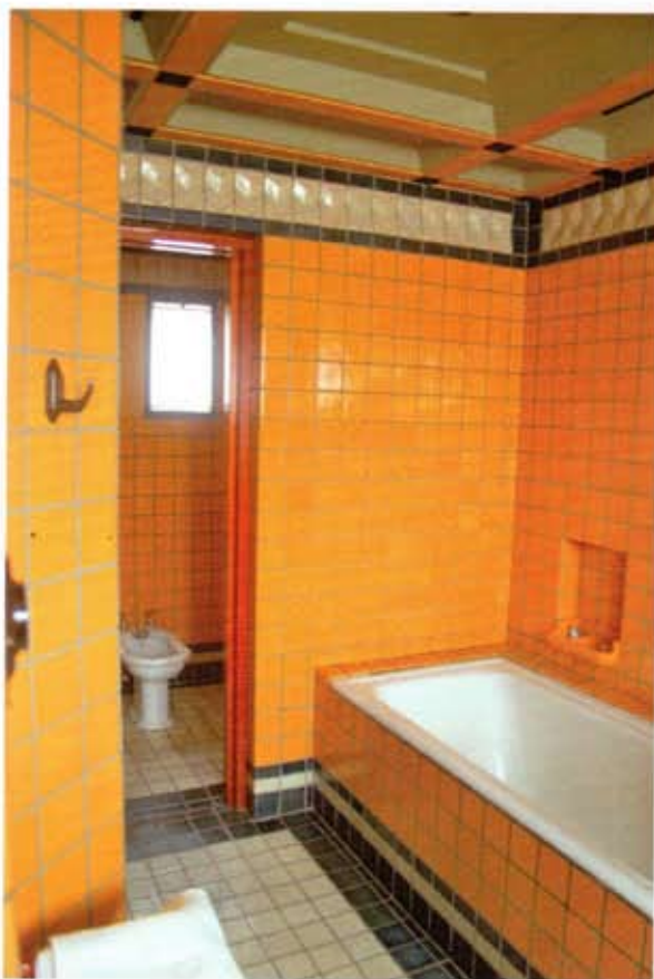
Afb. 3 Badkamer voor Anton Krölller-Müller in jachthuis Sint Hubertus, naar ontwerp van Hendrik Petrus Berlage, 1914, Hoenderloo.