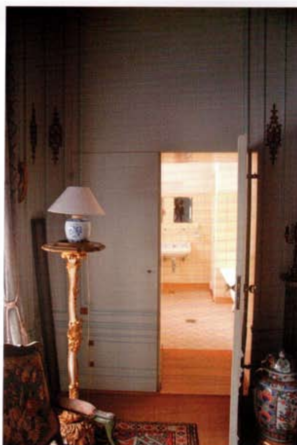
Afb. 4 Badkamer in Huis Singraven, ca. 1922, Denekamp.

voorbeeld van (afb. 4). Deze badkamer is veel eenvoudiger afgewerkt, met geel keramisch tegelwerk, en is verder niet gedecoreerd. In het huis is een tweede badkamer aanwezig, uitgevoerd in blauw tegelwerk en – heel bijzonder voor deze tijd – een aparte doucheruimte aan de hal.