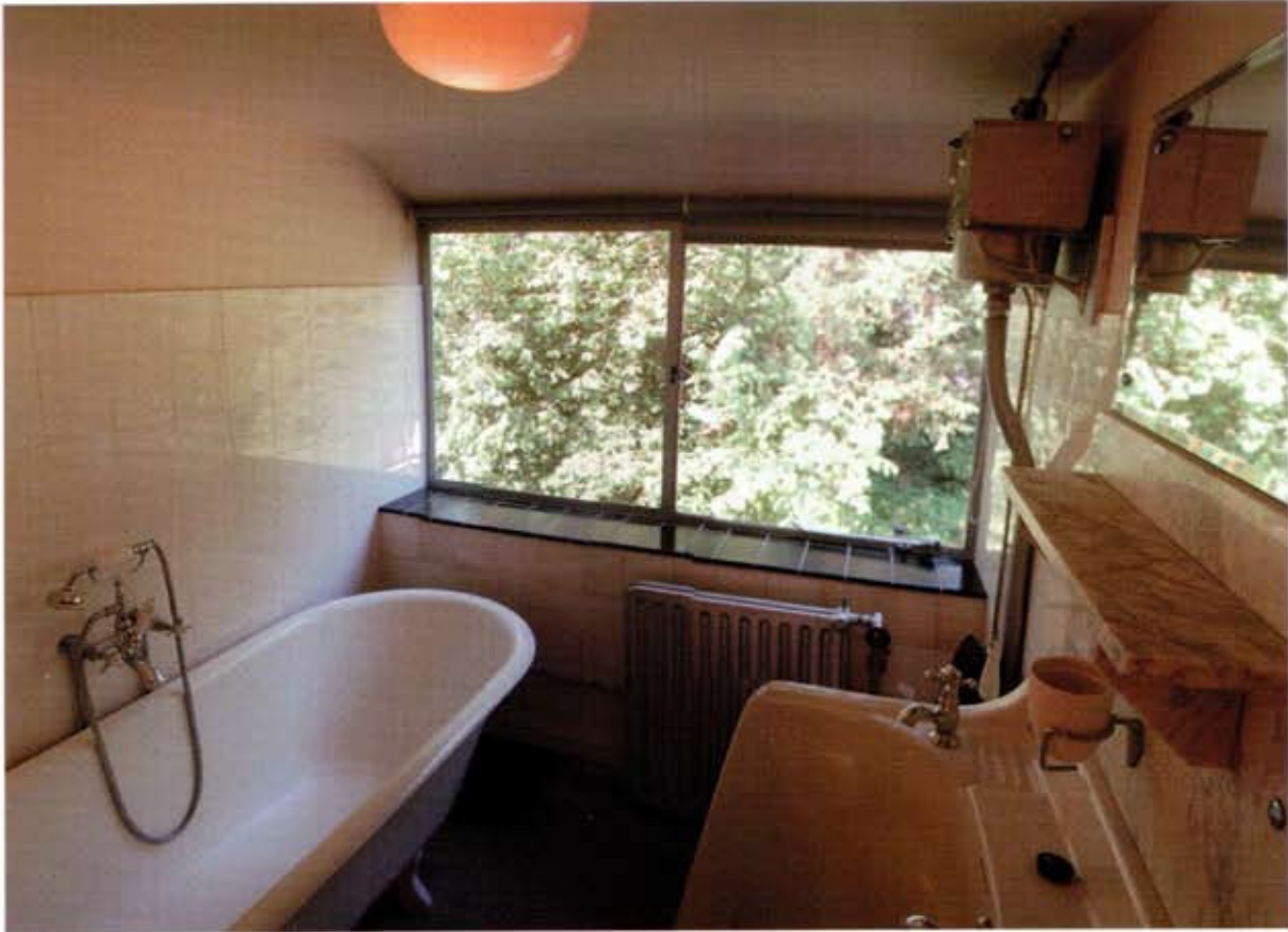
Afb. 5 Badkamer in Huis Hildebrand naar ontwerp van Gerrit Rietveld, 1935, Blaricum.

schikte pas tweederde van de Nederlandse huishoudens over een badkamer. 12 Vanaf de jaren tachtig is de badkamer echt voor iedereen bereikbaar en zijn alle functionele behoeftes van de gebruikers vervuld. Net als ten tijde van het ontstaan van de badkamer in de achttiende en negentiende eeuw is de badkamer nu wederom een statussymbool aan het worden: aan het sanitair en de afwerking van het vertrek wordt steeds meer geld uitgegeven. Waar de moderne badkamer ooit begon als een functionele ruimte bedoeld ter bevordering van de hygiëne, draait het in de badkamer tegenwoordig vooral om luxe en ontspanning.