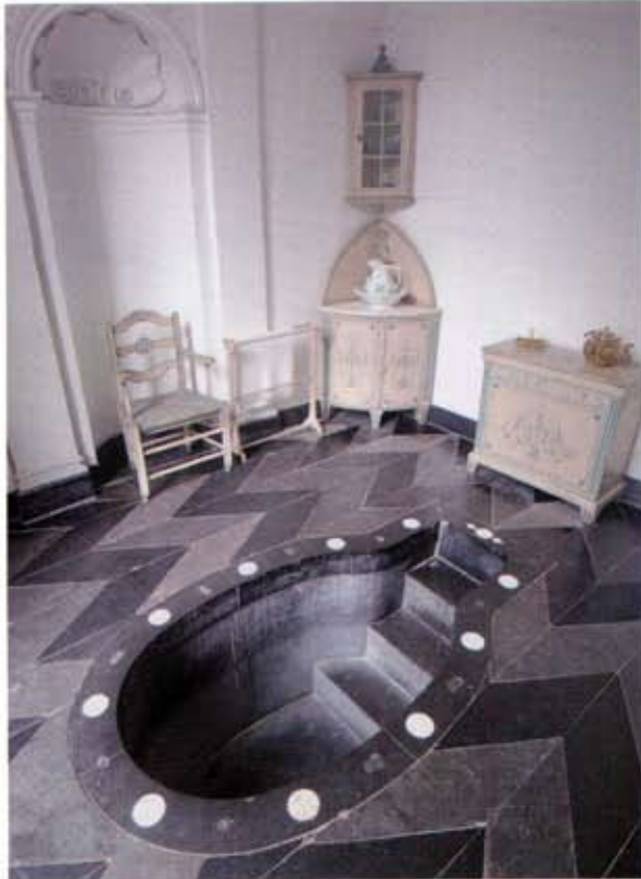
Afb. 1 Badkamer voor barones Johanna van Westreenen op kasteel Heeze, 1797, Heeze.

schikten ook de meeste herenhuizen over een badkamer, meestal voorzien van een bad en geiser, een spoeltoilet en een wastafel. Hierbij vormden hotelbadkamers een belangrijke inspiratiebron. Buitenlandse, maar ook enkele Nederlandse hotels boden namelijk al vanaf omstreeks 1860 badkamers aan voor hun hotelgasten. Wat de reizigers aantreffen tijdens hun reizen wilden zij graag ook thuis verwezenlijkt zien. 8