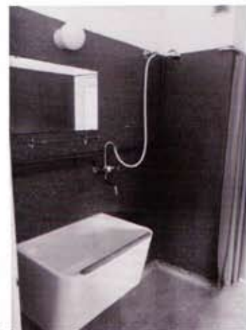
Afb. 6 Badkamer in instructiewoning in Amsterdam Osdorp, 1962.