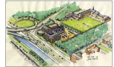
Overzicht en context