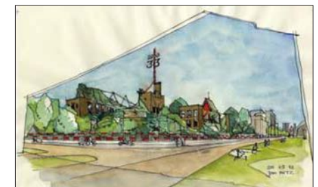
Elegant en veilig verval