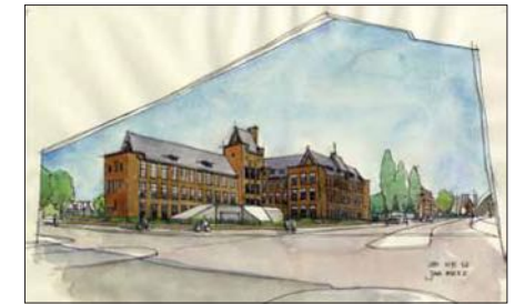
Vorbereiding herontwikkeling RVB